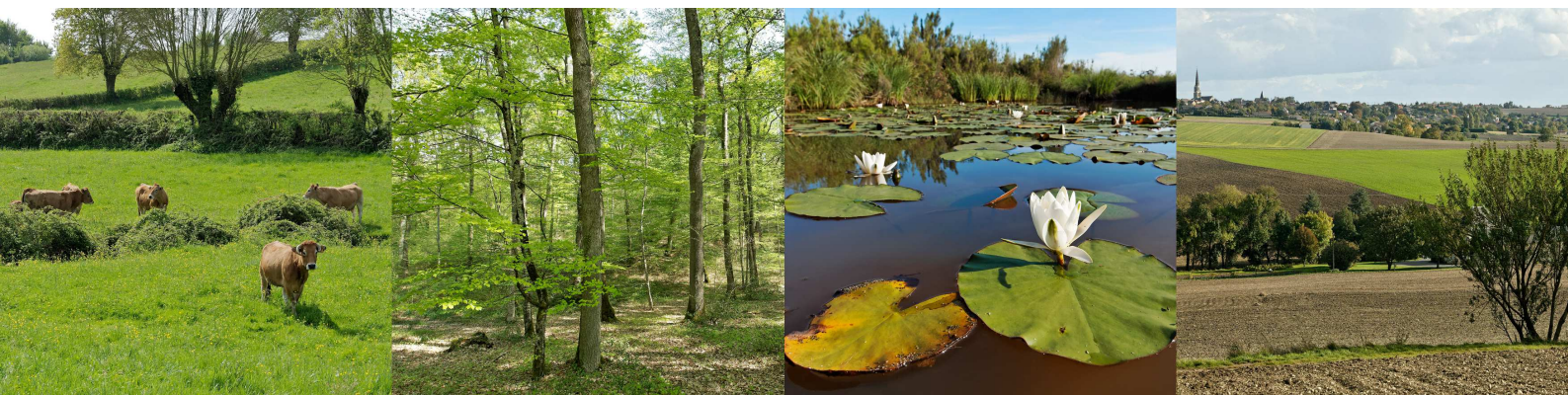
Schéma régional de cohérence écologique Poitou-Charentes